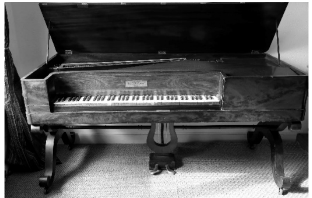
Piano carré Pleyel de juillet 1835

acquéreurs de pianos, dont les noms sont fournis par les registres des ventes des deux entreprises, en utilisant les méthodes familières aux généalogistes (état civil, recensements des populations, Généanet, Filae, les relevés du CHPG, ...) et les sources accessibles en ligne. Je me suis limité à la période allant de 1829, début des archives Pleyel, à 1870 avant les changements politiques et sociaux provoqué par la guerre franco-prussienne de 1870. Après avoir examiné les conditions de la commercialisation des pianos, j'essaierai d'identifier les acquéreurs de ces instruments de musique, de déterminer leur milieu social et, dans une moindre mesure, l'usage qui en a été fait.