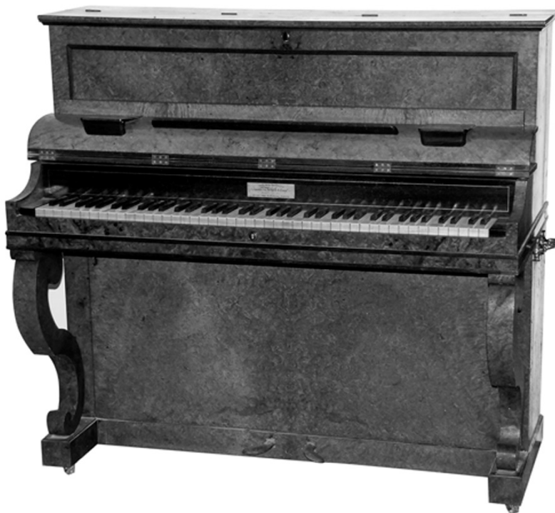
Pleyel Pianino, Paris, ca 1847